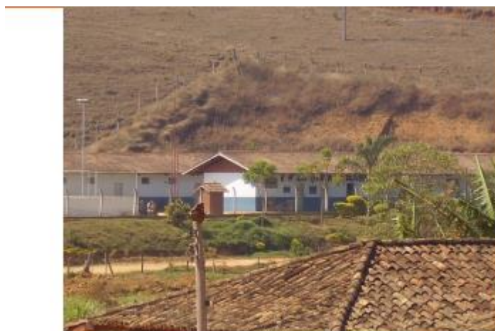
Escola na Comunidade São Pedro de Cima

A Escola Municipal Lia Marta é um palco constante de nossas reuniões com a comunidade, na escola são exibidos frutos do projeto e um local neutro onde todas as crianças oriundas de famílias das mais variadas religiões.