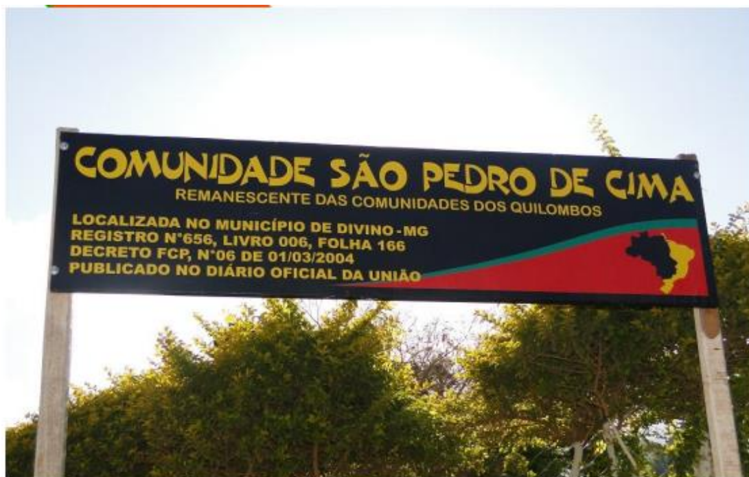
Placa de identificação da comunidade

O Movimento Negro Avura, surge a partir da demanda de professores e alunos, a fim de descobrir ou tentar desvendar suas origens. O movimento resiste na medida do possível, a empresa Samarco doa ao Avura instrumentos musicais e já estão planejadas oficinas com professores e alunos. O movimento atua na escola e, também tem ampla participação na disciplina de História da África que é uma das propostas contidas da Lei federal 10.639/2003.