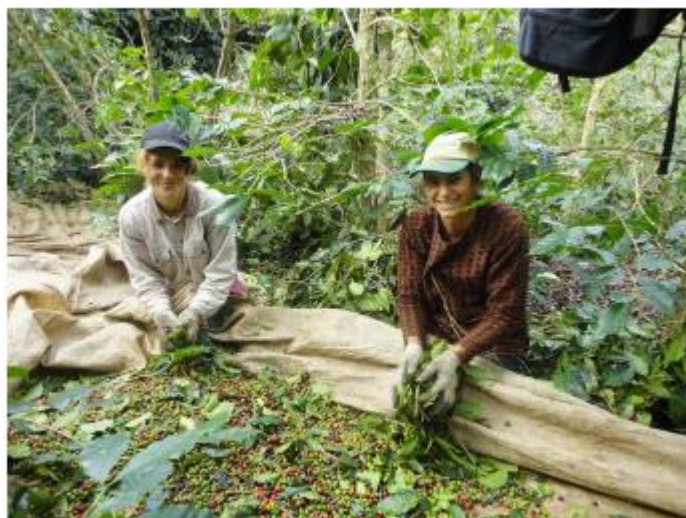
Panha do café