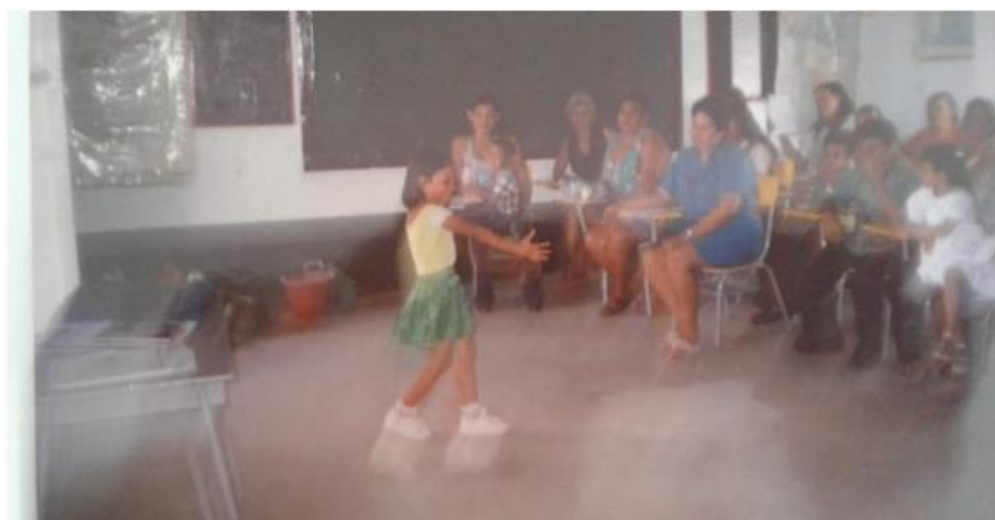
Foto de registro. Todas las fotos del artículo fueron tomadas en el aula especial, buscando la inclusión de niños autistas, con síndromes, población vulnerable y funcionalidad variada.